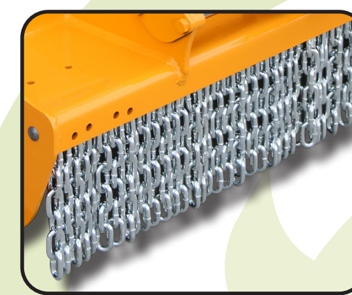
▶ Cadeias dianteiras