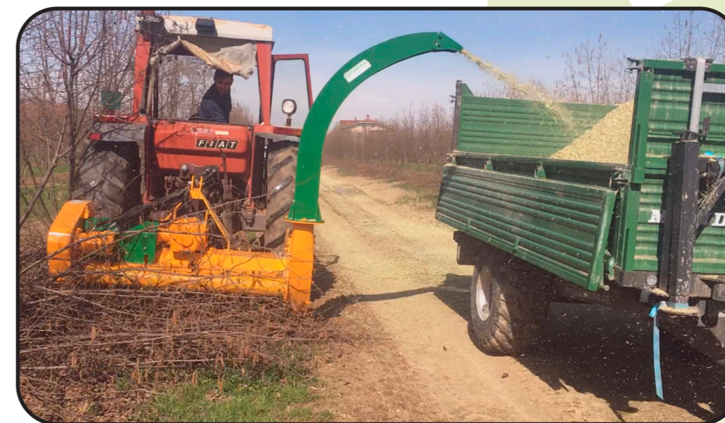
▶ Boca de saída alta