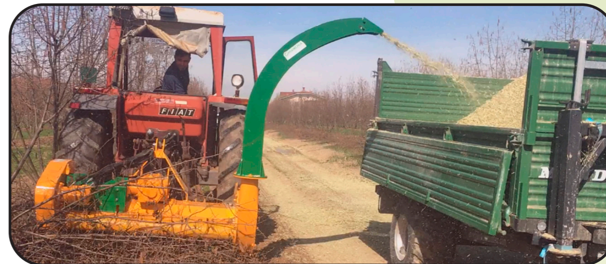
▶ Boca de saída alta